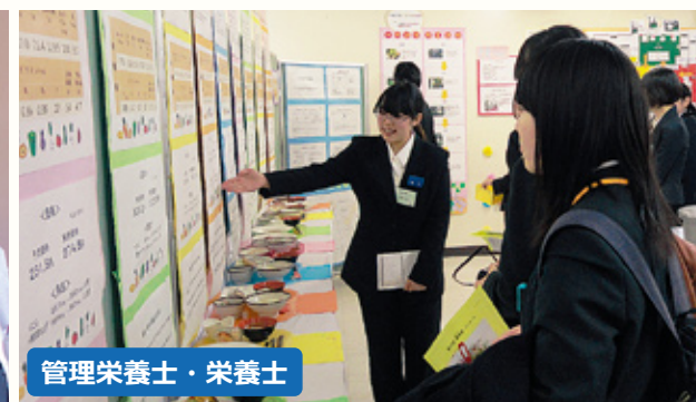
管理栄養士・栄養士